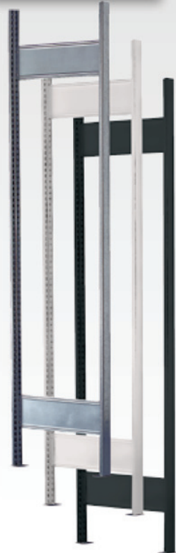
T-Profile bei 300 mm Tiefe: vorne ungelocht / hinten gelocht T-Profile bei 600 mm Tiefe: vorne / hinten ungelocht