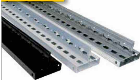
Passende Tiefenriegel zum Aufbau von T-Profil-Rahmen finden Sie auf Seite 77 im Stecksystem.